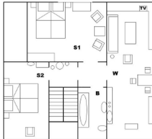
Der Grundriss der Ferienwohnung

Für die Übernachtung in unserer Ferienwohnung berechnen wir Ihnen folgende Preise: